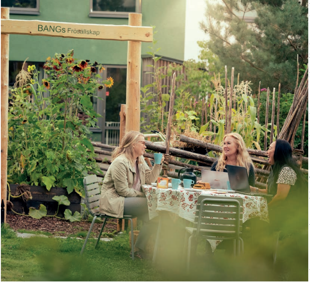
Omslaget: Kvarteret Göken, Kungsholmen, foto: SKB. Foto sida 2: iStock (vänster uppe), baraBild.se (höger uppe), Karl Nordlund (nedre).