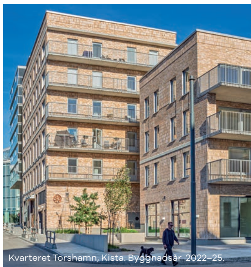
Kvarteret Torshamn, Kista. Byggnadsår 2022–25.