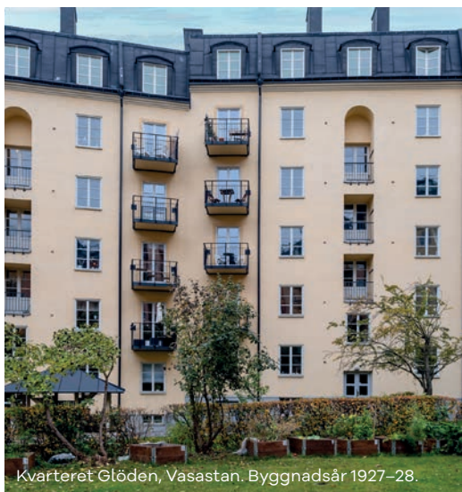
Kvarteret Glöden, Vasastan. Byggnadsår 1927–28.