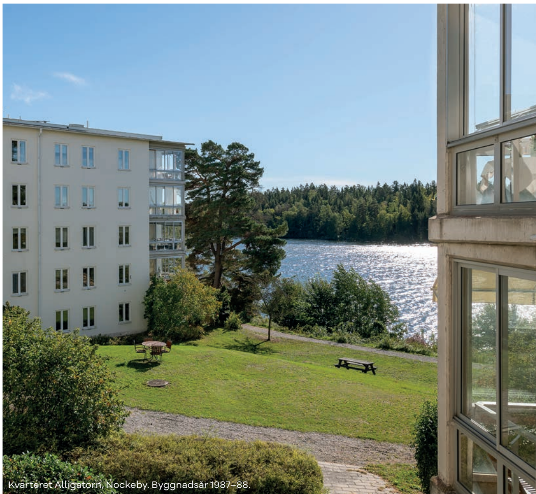
Kvarteret Alligatorn, Nockeby. Byggnadsår 1987–88.